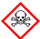
Toxisch / Giftig (GHS06)